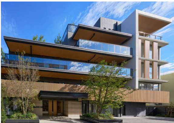
アズハイム神宮の杜(外観)

当ホームは、小高い丘の上に位置しており、5階にあるファミリールームと屋上テラスからは開放感あふれる景色を楽しむことができます。また、機能訓練エリアからは新宿の高層ビル群の眺望を望むことが可能です。