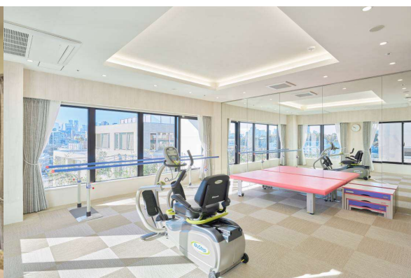
アズハイム神宮の杜(機能訓練エリア)