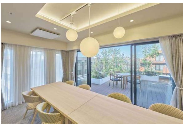
アズハイム神宮の杜(ファミリールーム)