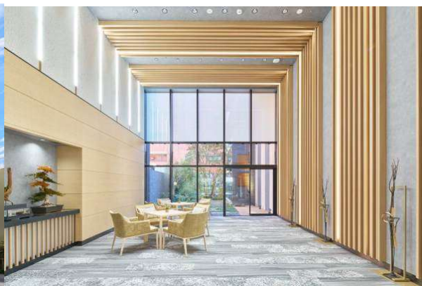
アズハイム神宮の杜(エントランスホール)