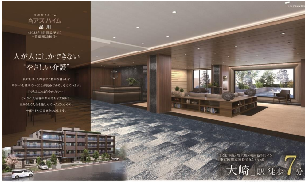
アズハイム品川 ポスター

2023年6月1日、東京都品川区に首都圏25棟目の介護付きホーム 「アズハイム品川」が新規オープン