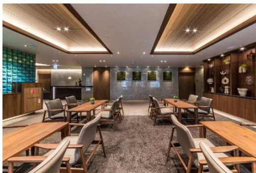
アズハイム城東公園 ラウンジ

「アズハイム城東公園」は、アズハイムシリーズ最大居室数の99床4階建て。屋上庭園も過去最大。「最期まで自分らしく、自分の力で・・・」の思いを叶えるためご入居者が歩行訓練をしたり、ガーデニングや家庭菜園などの趣味もお楽しみいただけ、まるで屋上に公園があるかのような開放感となっております。お客様を出迎える広々とした受付、エントランスなどの共用部、複数の接客スペースなど、建物全体で上質な生活空間を演出しております。