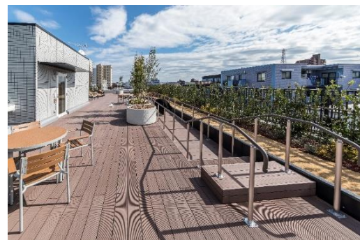
アズハイム城東公園 屋上庭園