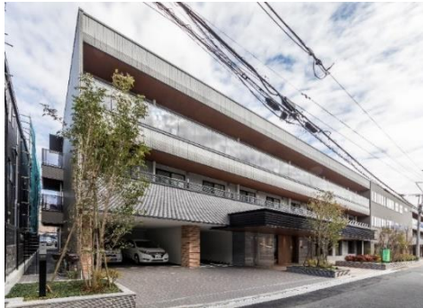
アズハイム城東公園 外観

株式会社アズパートナーズ、江東区初の介護付きホーム「アズハイム城東公園」を開設。 当社最大規模の居室数 99 室、リハビリやガーデニングができる開放的な屋上庭園を設置。 ホームへ続く四季の植栽が街を彩ります。